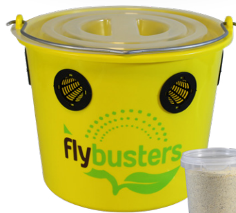
Seau Fly buster complet (seau + attractif) Réf. 129595