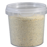
Recharge attractif Réf. 129595001

Le conseil du pro : Pour un résultat optimal, il est important de créer une zone autour de la ferme ou de la maison. Placez plusieurs seaux à mouches à 10-15 mètres de la ferme ou de la maison et laissez 15 m entre les seaux. Placez les seaux à 1,5 mètre du sol dans un endroit abrité.